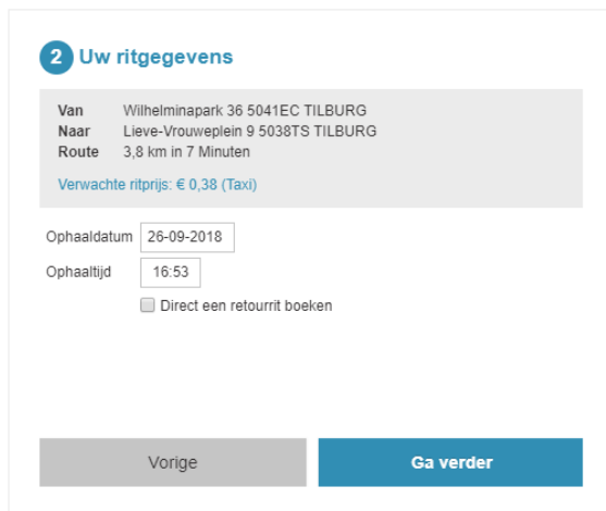
Figuur 4: Extern boekingsformulier

In het externe boekingsformulier is ondersteuning toegevoegd voor vervoerssoorten. Dit wil zeggen dat er meerdere externe boekingsformulieren gebruikt kunnen worden die verschillende tarieven/spelregels hanteren. Bij de boeking die wordt gedaan, wordt de vervoerssoort meegestuurd. Deze komt ook terug in Cabman Centrale.